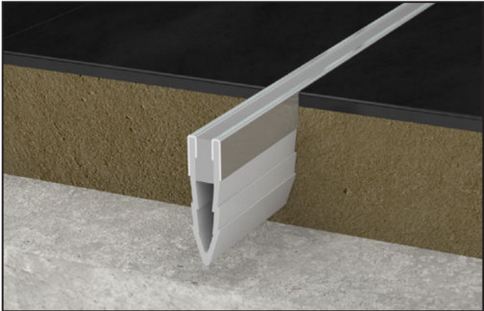
JF 700/S gris / JF 700/S grey