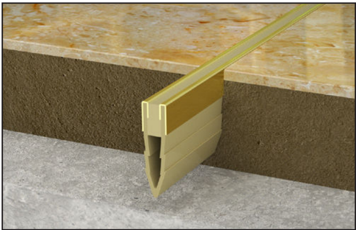
JF 700/B beige / JF 700/B beige