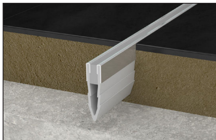
JF 700/S gris / JF 700/S grey