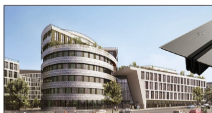
ECO CAMPUS SOCIÉTÉ GÉNÉRALE - CHATILLON