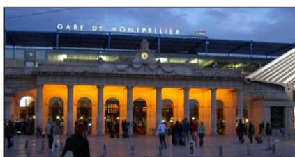
GARE SNCF - MONTPELLIER