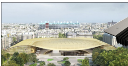
LA CANOPÉE DES HALLES - PARIS